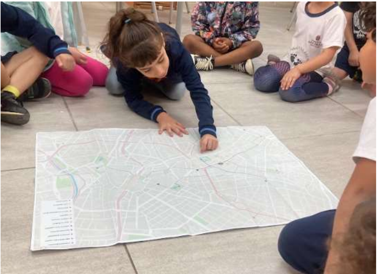
Figura 1 – Acompanhamento da roda de conversa com as crianças sobre as saídas ao longo do ano. Leitura sobre mapa físico, reflexão das experiências marcantes em campo. Foto de Adriana Lima, 2024.

LÉVY, Jacques. La cartographie, enjeu contemporain . In: Jacques Levy, Patrick Poncet et Emmanuelle Tricoire (org). La carte, enjeu contemporain . La Documentation Photographique , 2004, p. 1-16. Tradução de Eliane Kuvasney